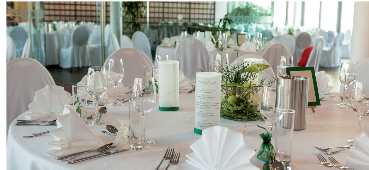
Heiraten im Landesmuseum

Lassen Sie sich von uns beraten, gerne stehen wir für ein persönliches Gespräch zur Verfügung.