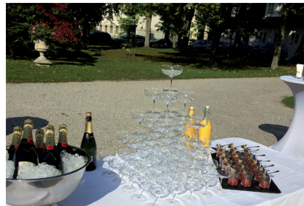
Champagner-Agape Südpark St. Pölten

Eine Übersicht finden Sie auf www.flieger-catering.at Oder rufen Sie uns einfach an, damit wir die Verfügbarkeit zu Ihrem gewünschten Termin prüfen und bestätigen können.