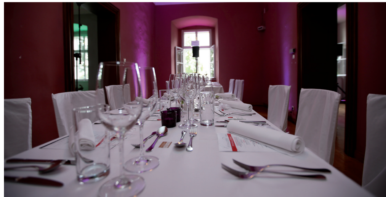
Gala Schloss Traismauer