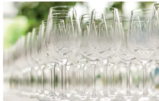
Südpark St. Pölten