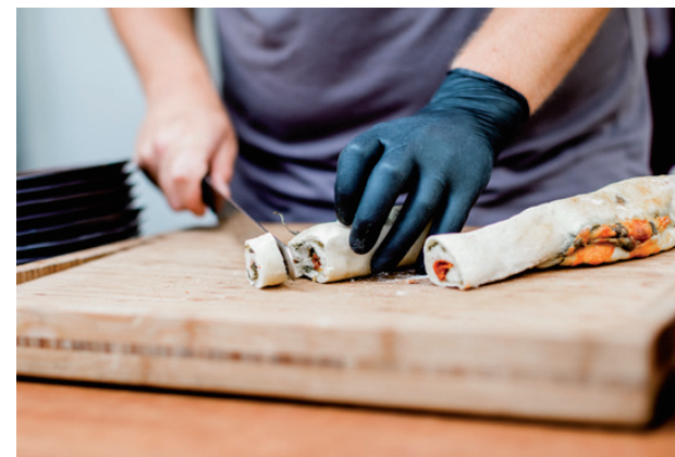
Tapas vom Grill