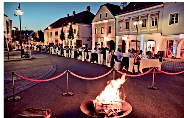
Genusstafel Hauptplatz Traismauer