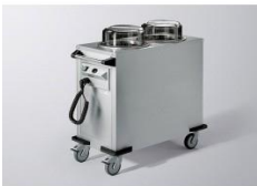
Tellerwärmer, für ca. 100 Teller