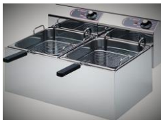
Fritteuse, 2x 6l