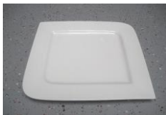
Design Teller, 25,5cm