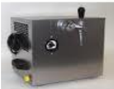
Bierzapfgerät "Partykühler" ohne Kohlensäue