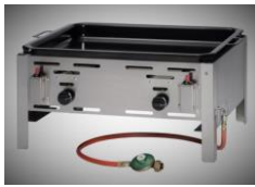
Gas - Tischgriller (ohne Gasflasche)