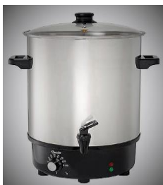
Glühweinkocher, ca. 27l