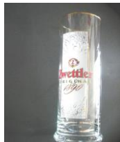
Bierglas, 0,3l "Zwettler"