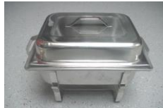
Chafing Dish, 1/2 GN