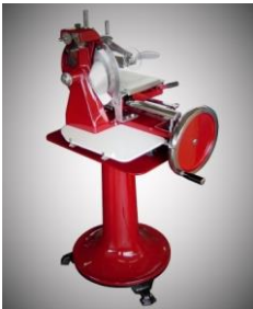
Prosciuttomaschine mit Standfuß