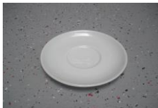
Kaffeuntertassen Espresso Untertasse