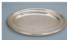
Silberplatten oval 44,5x30 cm