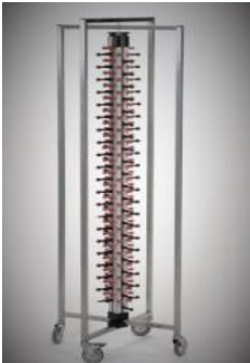
Tellerspinne für ca. 80 Teller