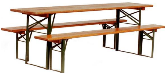
Heurigengarnitur (1Tisch, 2 Bänke)