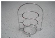
Fingerfoodständer für Brotteller 17cm