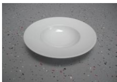
kl. Pastateller, 16cm