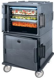
Thermobox, 16x 10er GN 1/1