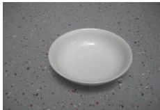
kleine Schüssel, 13cm