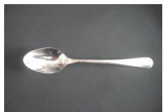
Suppen- oder Dessertlöffel "HEPP"