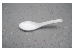
China - Löffel