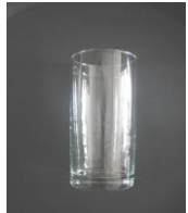
AF - Glas, 0,25l ohne Eichung