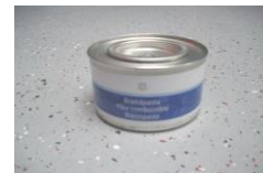
Brennpasta, Brenndauer ca. 3-4 Std.