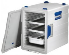
Thermobox, 4x 10er GN 1/1