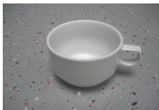
Kaffeetassen Espresso Tasse