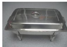
Chafing Dish, 1/1 GN